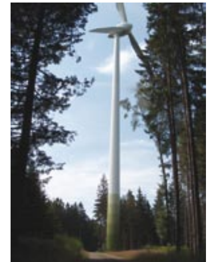
Die Platzierung von Windenergieanlagen in Wäldern ist für Fledermäuse sehr gefährlich und wird deshalb vom vorliegenden Leitfaden nicht befürwortet.

eines Abstandes von 200 m zum Waldrand errichtet werden, da an solchen Standorten die Risiken für alle Fledermausarten hoch sind. In der Nähe von Wäldern ist die Höhe der Anlagen von besonderer Bedeutung. Vor allem sollte auch die Fledermausaktivität oberhalb der Baumkronen beachtet werden. Wärmebildkameras und Drachen/Ballons mit Detektoren erlauben (auch im Wald) Angaben über Flughöhen. Falls Radar sich als eine nützliche Methode erweist, ist er hier jedoch wahrscheinlich weniger effizient als im Offenland. Besondere Berücksichtigung sollten sowohl hoch fliegende Arten finden als auch solche, die unmittelbar über den Baumkronen jagen, z.B. Nyctalus sp., Vespertilio murinus , Eptesicus sp., Myotis bechsteinii , Myotis nattereri , Myotis myotis , Pipistrellus sp., Hypsugo savii und Barbastella barbastellus .