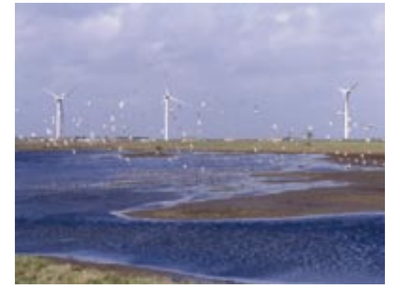
Der französische Windpark in Bouin (Vendée, Frankreich) an der Atlantikküste, wo regelmäßig wandernde Fledermäuse tot unter den Windrädern gefunden werden. Die betroffenen Arten sind vor allem Rauhhautfledermäuse ( Pipistrellus nathusii ), Abendsegler ( Nyctalus noctula ) und Zwergfledermäuse ( Pipistrellus pipistrellus ).

Mit Ausnahme der Dämmerungszeiten, wenn Sichtbeobachtungen möglich sind, können Untersuchungen zum Verhalten der Fledermäuse nur mit teuren Technologien durchgeführt werden, so z.B. mit Infrarotkameras, Wärmebildkameras oder mit leistungsstarker Beleuchtung. Wegen dieser Kosten ist der Einsatz solcher Ausrüstung begrenzt auf problematische Standorte oder auf Grundlagenforschung. Jedoch kann man schon mit einem handgesteuerten Detektor Hinweise auf Fledermausverhalten erhalten, zumindest um Jagd und Überflug zu unterscheiden.