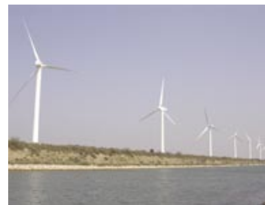
Ein Windpark im Rhônedelta (Camargue, Südfrankreich). 21 Windräder wurden 2005 auf einen Deich gebaut. 2006 wurden 12 tote Fledermäuse gefunden, darunter Langflügel-Fledermäuse ( Miniopterus schreibersii ). Die Baugenehmigung wurde zu einer Zeit erteilt, als kein Fledermaus-Gutachten für eine Verträglichkeitsstudie nötig war, obwohl dieses Feuchtgebiet (Ramsar-Schutzgebiet) ein Hotspot für überwinternde Vögel und wandernde bzw. jagende Fledermäuse ist.