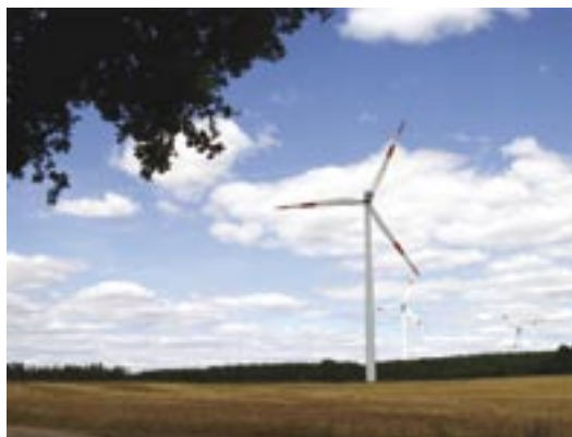
Windpark Puschwitz in Sachsen, Deutschland. 10 Windenergieanlagen stehen in einer hügeligen Landschaft mit sehr strukturreichen Lebensräumen, in denen sich viele Wasserläufe befinden. Zwischen 2002 und 2006 wurden unter den Windrädern insgesamt 76 tote Fledermäuse gefunden, darunter hauptsächlich Abendsegler ( Nyctalus noctula ), Rauhhautfledermäuse ( Pipistrellus nathusii ), Zwergfledermäuse ( Pipistrellus pipistrellus ) und Zweifarbfledermäuse ( Vespertilio murinus ).

ten zum anderen gelaufen werden, können somit einen 2,5 bzw. 5 m breiten Bereich zu jeder Seite abdecken.