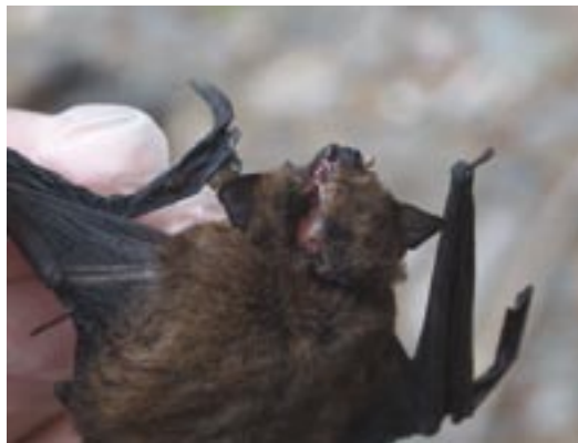
Eine Zwergfledermaus ( Pipistrellus pipistrellus ), die mit zertrümmertem Schädel tot unter einem Windrad gefunden wurde (Deutschland). Arten, von denen man weiß, dass sie in geringen Höhen fliegen, werden ebenfalls als Unfallopfer unter den Windrädern gefunden.