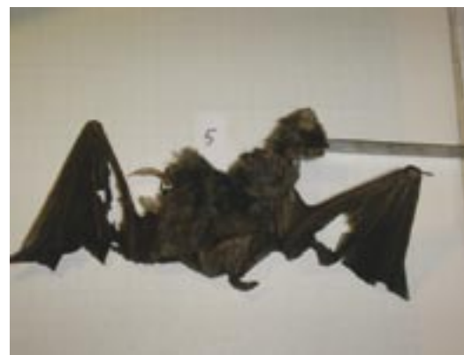
Wandernde und lokal ansässige Tiere verschiedener Fledermausarten werden in ganz Europa als Schlagopfer unter Windrädern gefunden. Abendsegler (Nyctalus noctula) sind die am meisten betroffene Art (hier Windpark Puschwitz in Sachsen, Deutschland).