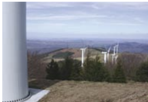
Windpark auf einem Bergrücken am Rande eines Rotbuchenwaldes (Aveyron, Frankreich), gebaut im Jahre 2002. Zu dieser Zeit war über die Auswirkungen von Windenergieanlagen auf Fledermäuse noch nicht viel bekannt und keine Untersuchung zu Fledermäusen gemacht worden.

Das Ziel der Vorstudie ist es aufzuzeigen, welche Fledermausarten und Landschaftselemente, die von Fledermäusen genutzt werden, in dem betroffenen Gebiet potenziell gefährdet sind. Diese Ergebnisse bilden die Grundlage für die Bewertung und Konfliktanalyse und geben in der Folge Hinweise für Vermeidung, Verminderung und Ausgleich der Eingriffe. In Kenntnis der Auswirkungen, die Windenergieanlagen auf Fledermäuse haben können, wird empfohlen, dass Vorstudien für alle neuen Anlagen im Binnenland und Offshore-Bereich durchgeführt werden. Die Vorstudie ist ein erster Schritt, um Hinweise auf mögliche Auswirkungen auf Fledermäuse zu sammeln, dem Bauträger in seiner Entscheidungsfindung zu helfen und zu zeigen, ob detaillierte Studien notwendig sind.