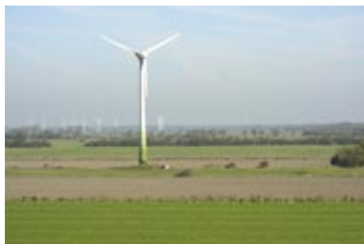
Windpark in Norddeutschland. Jagdhabitats von Breitflügelfledermäusen ( Eptesicus serotinus ) und Zwergfledermäusen ( Pipistrellus pipistrellus ) findet man in dieser strukturierten Landschaft regelmäßig. Um Schlagopfer zu vermeiden, sollte ein Mindestabstand von 200 m zu solchen Vegetationsstrukturen eingehalten werden.

Die abzusuchende Fläche (Quadrate sind Kreisen vorzuziehen) wird mit vier Eckpfosten markiert und zwei gegenüberliegende Seiten werden mit weiteren Pfosten markiert, die Abstände von 5 oder 10 m darstellen. Die Transekte, die von einem Pfosten