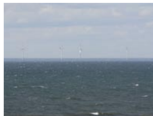
Offshore-Windparks wie hier in Schweden können negative Auswirkungen auf Fledermäuse haben, wenn sie auf traditionellen Zugwegen errichtet werden.

Abhängig von den geografischen Bedingungen und den Arten, die in einem Gebiet überwintern, werden der Anfangszeitpunkt und das Ende einer Untersuchung variieren, da der Winterschlaf in Südeuropa kürzer ist