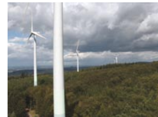
Ein Windpark im Schwarzwald in Deutschland. Lokale Populationen von Zwergfledermäusen ( Pipistrellus pipistrellus ) wurden von diesen Windenergieanlagen beeinträchtigt, aber auch wandernde Arten wie z.B. Kleine Abendsegler ( Nyctalus leisleri ).

Wenn die potenziellen Auswirkungen einer geplanten Windenergieanlage geprüft werden, sollten lokale Bewegungen von Fledermäusen zu und von den Jagdhabitaten, großräumige Wanderungen zwischen Sommer- und Winterquartieren sowie herbstliche Schwärmflüge beachtet werden.